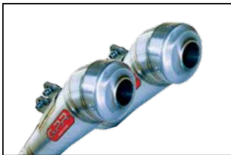
G.P.R. Doublepipe Powercone E-geprüft!