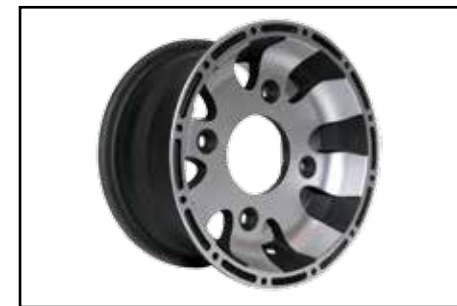
ALU Felgenkit (4 Stk.) E-geprüft!