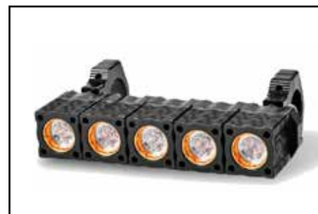
Heretic Light Bar (10 inch)