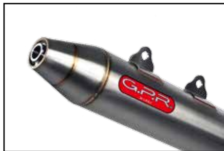
G.P.R. Auspuffanlage Bullet LoF E-geprüft!