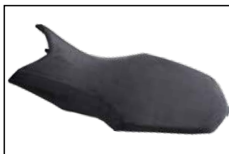
Sitzbankbezug Navara schwarz