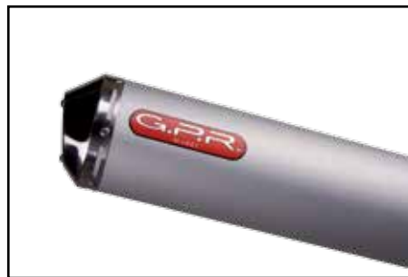
G.P.R. Sportendtopf Alu E-geprüft!