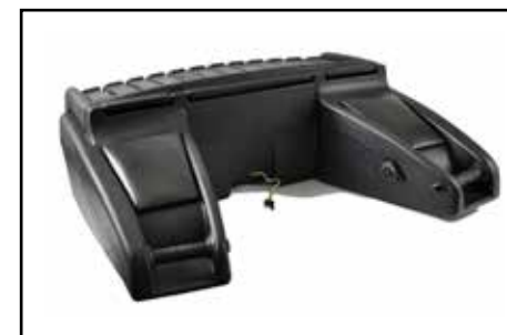
Kimpex Koffer Trunk 2 UP/SEAT