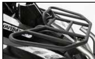
Gepäckbrücken vorne & hinten

Die ausgereifte Bauart Triton-Outback hebt sich durch ihren leistungstarken Motor von der Konkurrenz ab. Das Outback 400 4x4 brilliert noch zusätzlich mit elektrisch zuschaltbarem Allradantrieb und einer 100 % sperrbaren Differenzialsperre der Vorderachse. Ob große Tour oder Arbeitseinsatz, die beiden Gepäckbrücken, sowie die abschließbaren Staufächer bieten ausreichend Platz für allerlei Wichtiges.