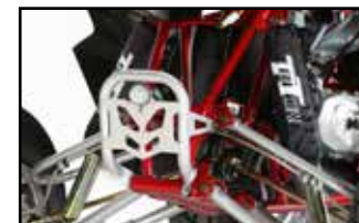
Sportfahrwerk mit A-Arms