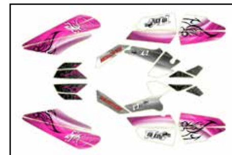
Triton Sticker KIT Pink