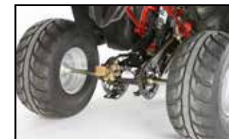
Speed Racer Bereifung