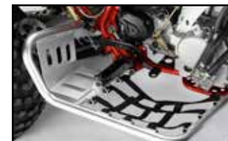
Nerfbars mit Heel-Guards