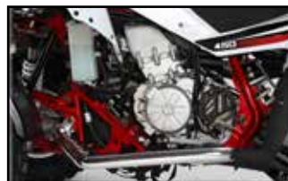
5-Gang Hi-Output Motor

So muss sich ein Quad anfühlen: Die Spitze der Nahrungskette hört auf den Namen Reactor 450. Das Herzstück des Sportquads stellt der wassergekühlte 449 ccm Viertakt-Einzylindermotor mit sportlich abgestimmtem Schaltgetriebe und zwei oben liegenden Nockenwellen dar. Aus dem Drehzahlkeller heraus reiten Sie damit auf einer beeindruckenden Drehmomentwelle über eine kraftstrotzende Mitte in Richtung Höchstdrehzahl.