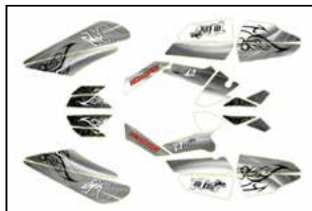
Triton Sticker KIT Grau