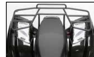
Gepäckbrücken vorne & hinten